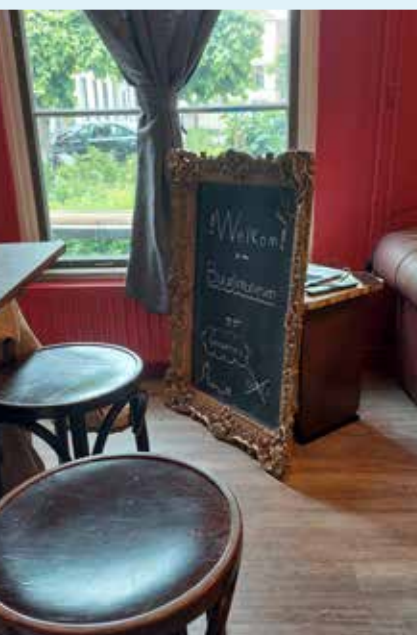
Voor aankondiging op 28 mei bij de voorjaarsborrel van de buurtvereniging

Het Noordenbergkwartier heeft nu een eigen buurtmuseum in het voormalig atelier van De Fermerie. Het initiatief hiertoe werd genomen door enkele buurtbewoners in samenwerking met De Fermerie. Er is een muurschildering gemaakt van de ontstaansgeschiedenis van Deventer en van het behoud van het Noordenbergkwartier in de jaren '80 van de vorige eeuw. Hier zijn prachtige foto's gemaakt door J. Levy van het oude Noorden te zien. Een fijne ruimte om samen te zijn en de buurt beter te leren kennen.