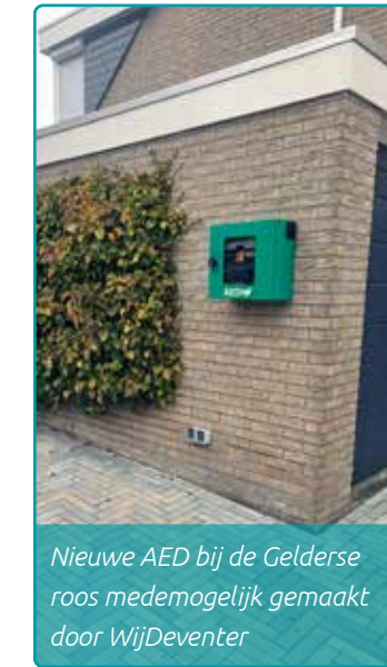
Nieuwe AED bij de Gelderse roos medemogelijk gemaakt door WijDeventer