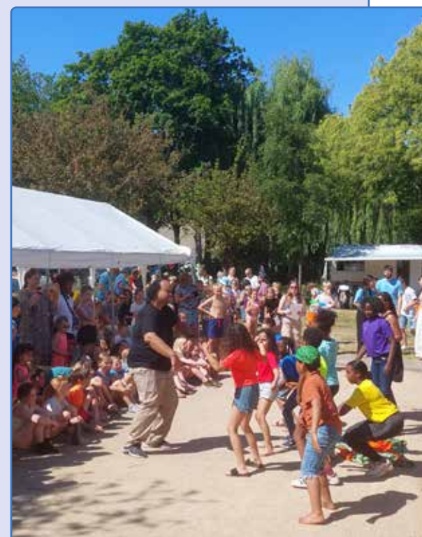
De zonnige buitenspeeldag van vorig jaar

Dit doen ze samen met de kinderwerkers van Raster. Dit jaar zullen er ook weer allerlei geweldige speelmogelijkheden voor de kinderen zijn. Daarnaast is er een informatiemarkt voor de ouders en volwassenen uit de buurt. Een aantal organisaties in de wijk zullen zich daar presenteren met nuttige informatie. Nu maar hopen op mooi weer om er net als vorig jaar een prachtig kinderfeest van te maken.