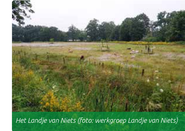
Het Landje van Niets