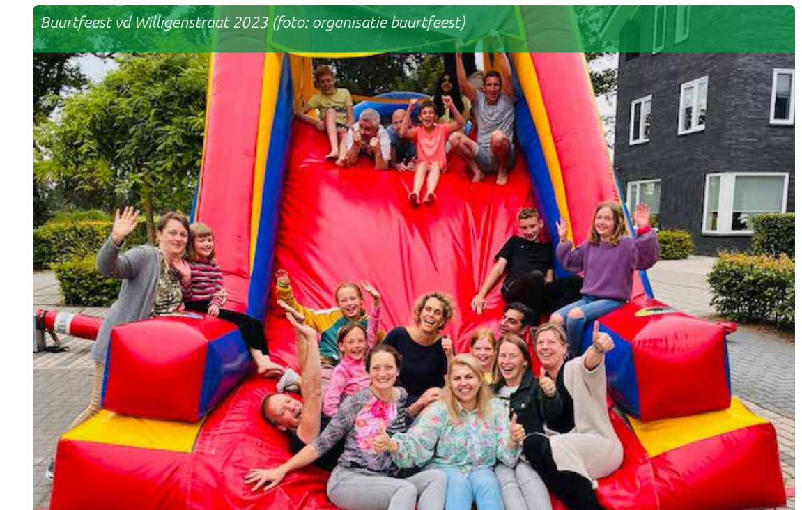
Buurtfeest vd Willigenstraat 2023

Elk jaar worden er in Colmschate Noord en de Vijfhoek vele tientallen straat- en buurtfeesten georganiseerd. Dat is natuurlijk in de eerste plaats heel leuk en gezellig voor alle kinderen en volwassenen, maar ook heel goed om elkaar wat beter te leren kennen. Er ontstaan dan vaak ook weer andere ideeën om het wonen en leven in de straat nog prettiger te maken. Er zijn vele voorbeelden van grote initiatieven die begonnen zijn op een straatfeest. Vanuit WijDeventer is er de mogelijkheid om voor een straatfeest een bijdrage aan te vragen om bijvoorbeeld een springkussen te huren. Die bijdrage is maximaal €250,- en is niet voor eten of drinken. Voor meer informatie kun je kijken op de website www.wij.deventer.nl , onder het kopje "wijkbudget aanvragen".