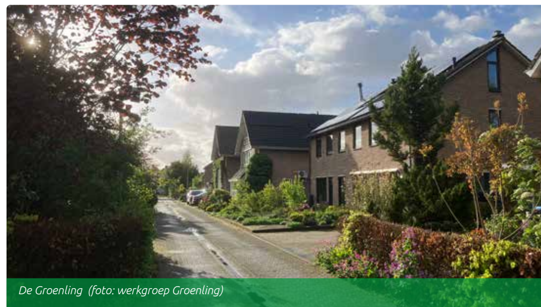
De Groenling

Alle Groenling-bewoners zijn per brief geïnformeerd en het merendeel doet mee. Het werkt, hulp vragen blijkt nu laagdrempeliger. Op eigen verzoek gaat een aantal burensamenlijk een reanimatiecursus volgen.