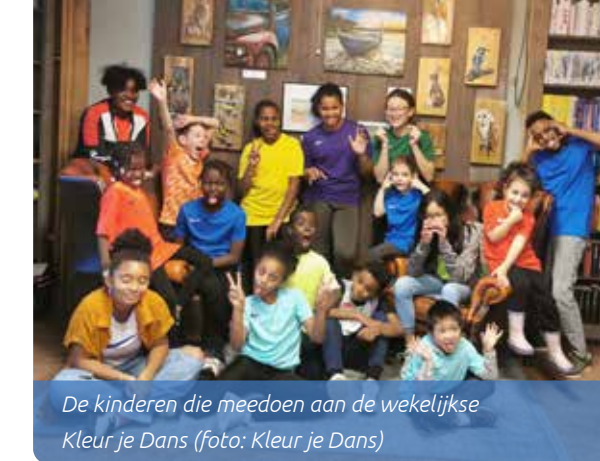
De kinderen die meedoen aan de wekelijkse Kleur je Dans