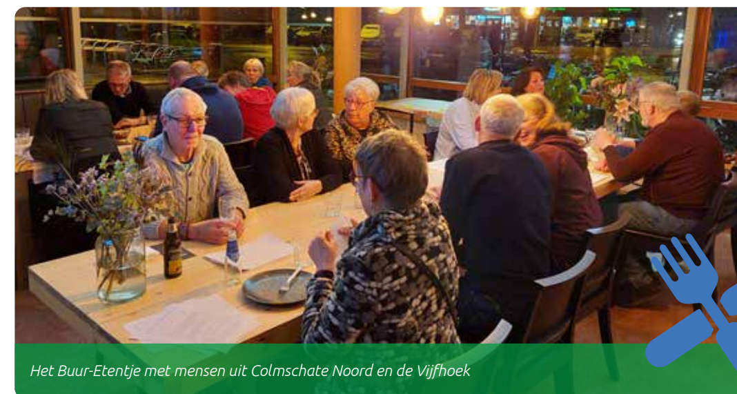
Het Buur-Etentje met mensen uit Colmschate Noord en de Vijfhoek

Zo'n 20 bewoners en buurtprofessionals ontmoetten elkaar tijdens het eerste Buur-Etentje! Ze spraken over het signaal dat er bij onenigheid tussen burens weinig gebruik wordt gemaakt van Buurtbemiddeling. Herkennen de bewoners dit? Wat doen ze om het met elkaar leefbaar en gezellig te houden? Het signaal werd herkend. Niet iedereen kende Buurtbemiddeling. De bewoners vonden het waardevol te horen, dat je er ook terecht kunt voor 'licht' advies of een luisterend oor. Dat maakt de drempel lager. Ze deelden mooie voorbeelden over hoe het samenleven leuk blijft. Zorg dat je de burens kent. Zorg dat het eerste contact geen klaagcontact is. Verwelkom nieuwe buurtgenoten met een bloemetje of kaartje. Door dat 'welkom-gevoel' ontstaat direct begripvol contact. En denk na over hoe je als initiatiefnemer op termijn het stokje over kunt dragen. We kijken nu al uit naar het volgende Buur-Etentje!