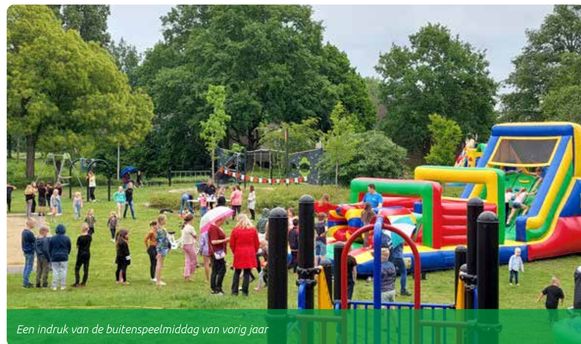
Een indruk van de buitenspeelmiddag van vorig jaar

Op woensdag 14 juni wordt er net als vorig jaar weer een geweldige buitenspeelmiddag georganiseerd in het Oostrikpark. Een groep bewoners zet hier weer de schouders onder, samen met de kinderwerkers van Raster. Het Oostrikpark heeft er het afgelopen jaar een aantal prachtige speeltoestellen bij gekregen. Op deze middag zijn er ook nog een aantal leuke springkussens waarop gespeeld kan worden. Intussen is door de werkgroep Oostrikpark geregeld dat er, als laatste toevoeging aan de vorig jaar helemaal opgeknapte speeltuin, ook nog een prachtige waterpomp is gekomen. Vorig jaar vond de buitenspeelmiddag plaats in de stromende regen, maar dat kon de kinderen niet tegenhouden. Toch hopen we dit jaar op 14 juni in de middag op heel mooi weer.