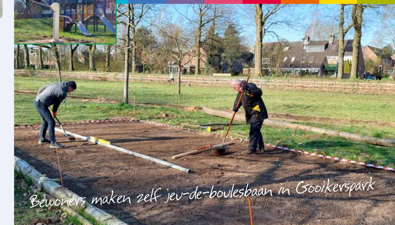
Bewoners maken zelf jeu-de-boulesbaan in Gooikerspark

WijDeventer COLMSCHATE-NOORD WijDeventer VIJFHOEK