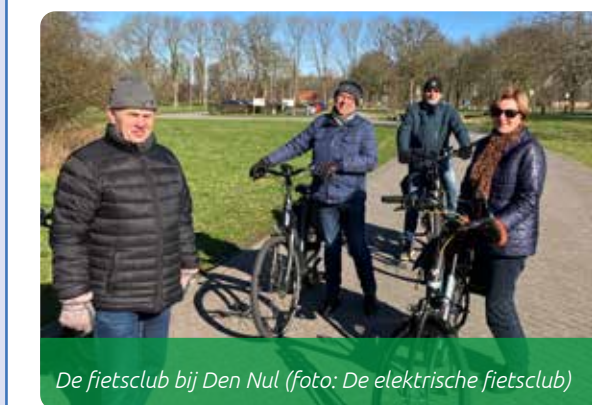
De fietsclub bij Den Nul

Gemiddeld trappen ze ruim 30 km weg, maar naast het sportieve is ook het sociale gebeuren belangrijk voor iedereen. Met als het even kan een koffiestop onderweg en een beetje kletsen, draagt het allemaal bij aan een gezellige ochtend. Denk je .... dit is ook wel wat voor mij/ons, fiets een keertje mee. Je krijgt er beslist geen spijt van en wie weet wordt het, net als voor hen, ook voor jou een leuke wekelijkse bezigheid. Je bent van harte welkom.