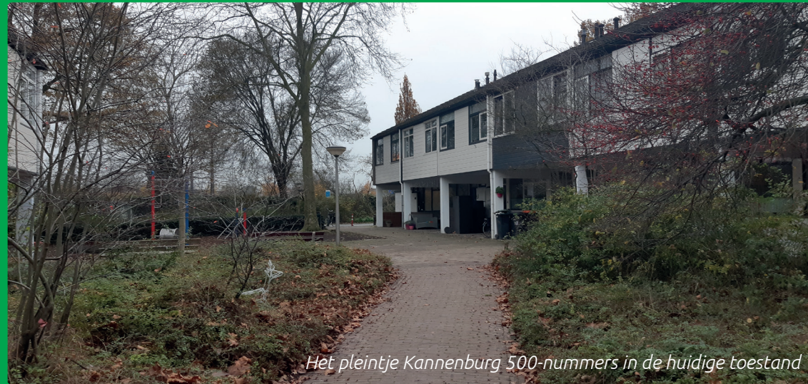
Het pleintje Kannenburg 500-nummers in de huidige toestand

Het pleintje bij de Kannenburg 500-nummers wordt onder handen genomen. De bewoners zijn al verschillende jaren actief door het pleintje enkele keren per jaar schoon te maken. Nu willen ze ook nog een aantal aanpassingen aan het pleintje om het nog veiliger, mooier en aantrekkelijker te maken. Met vele omwonenden is erover nagedacht en er is een