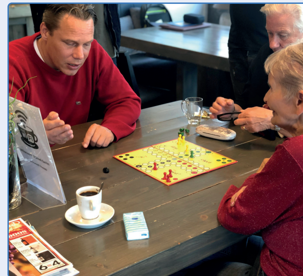
Een 'ontspannen' activiteit (voor Corona)

Het is ook een plek waar u als bewoner aan zet bent. Een voorbeeld: een bewoonster uit de wijk heeft de wens om spullen die zij niet