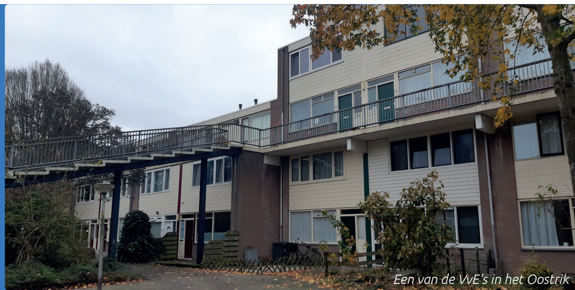
Een van de VvE's in het Oostrik