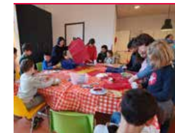
Periodieke uitgave WijDeventer mei 2020