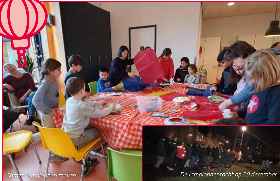
Samen lampionnen maken