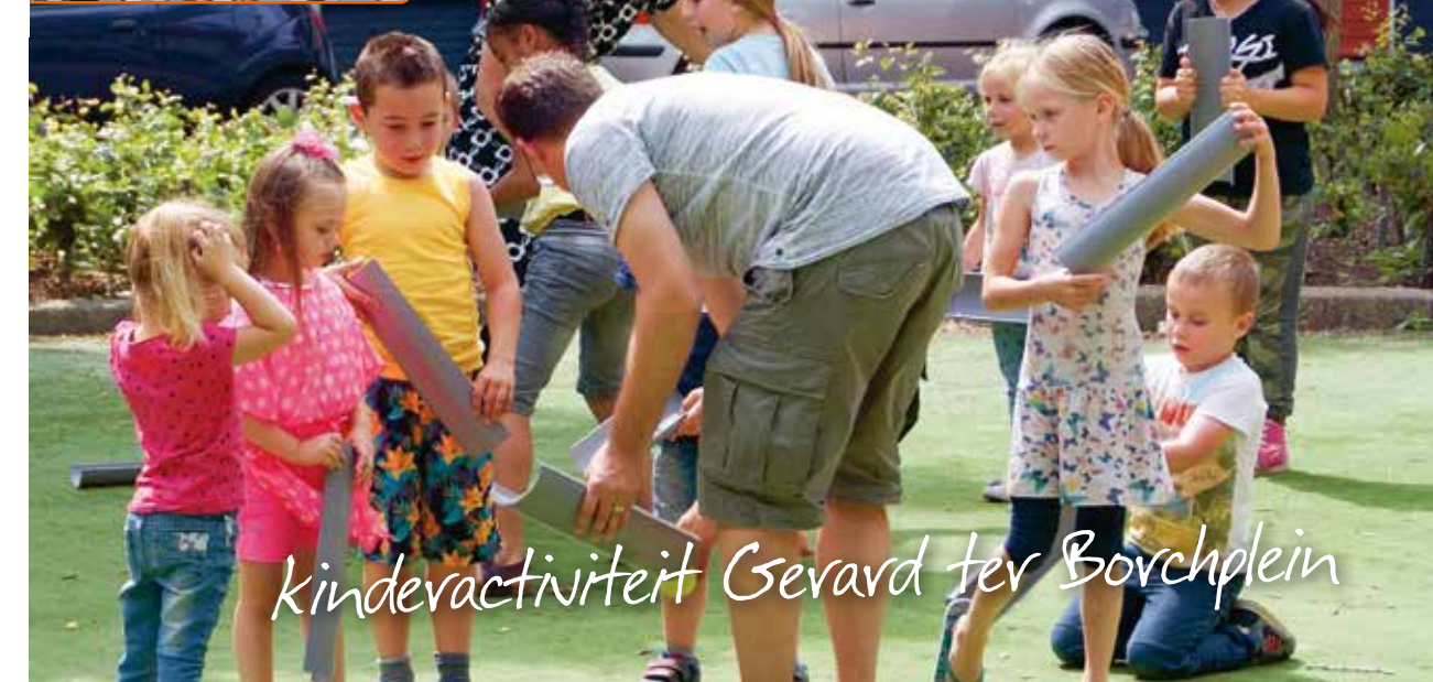
Kindervoorziening Gerard ter Borchplein