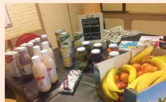
Samen rijk in de wijk