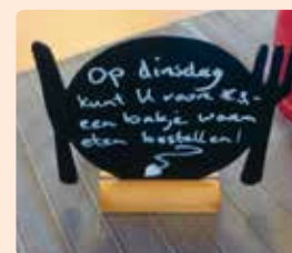
Samen rijk eten Zandweerd