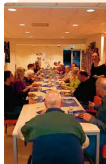
Samen eten: in samenwerking met Stichting Philadelphia en buurtgenoten