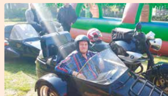
Zijspantocht voor de liefhebbers tijdens de nationale burendag bij speeltuin de Tulp