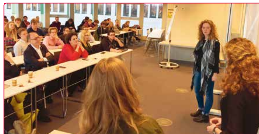
De studenten presenteren hun bevindingen aan klasgenoten, directie, wethouder en wijkmanagers.