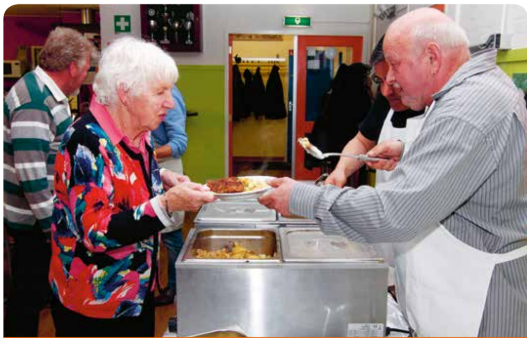
Iedere maandag koken vrijwilligers een driegangendiner voor buurtbewoners

Iedere maandag eten buurtbewoners met elkaar bij WSV de IJssel. De uitgangspunten? Vers en gezond. En verder is het vooral een heel gezellig eetgebeuren.