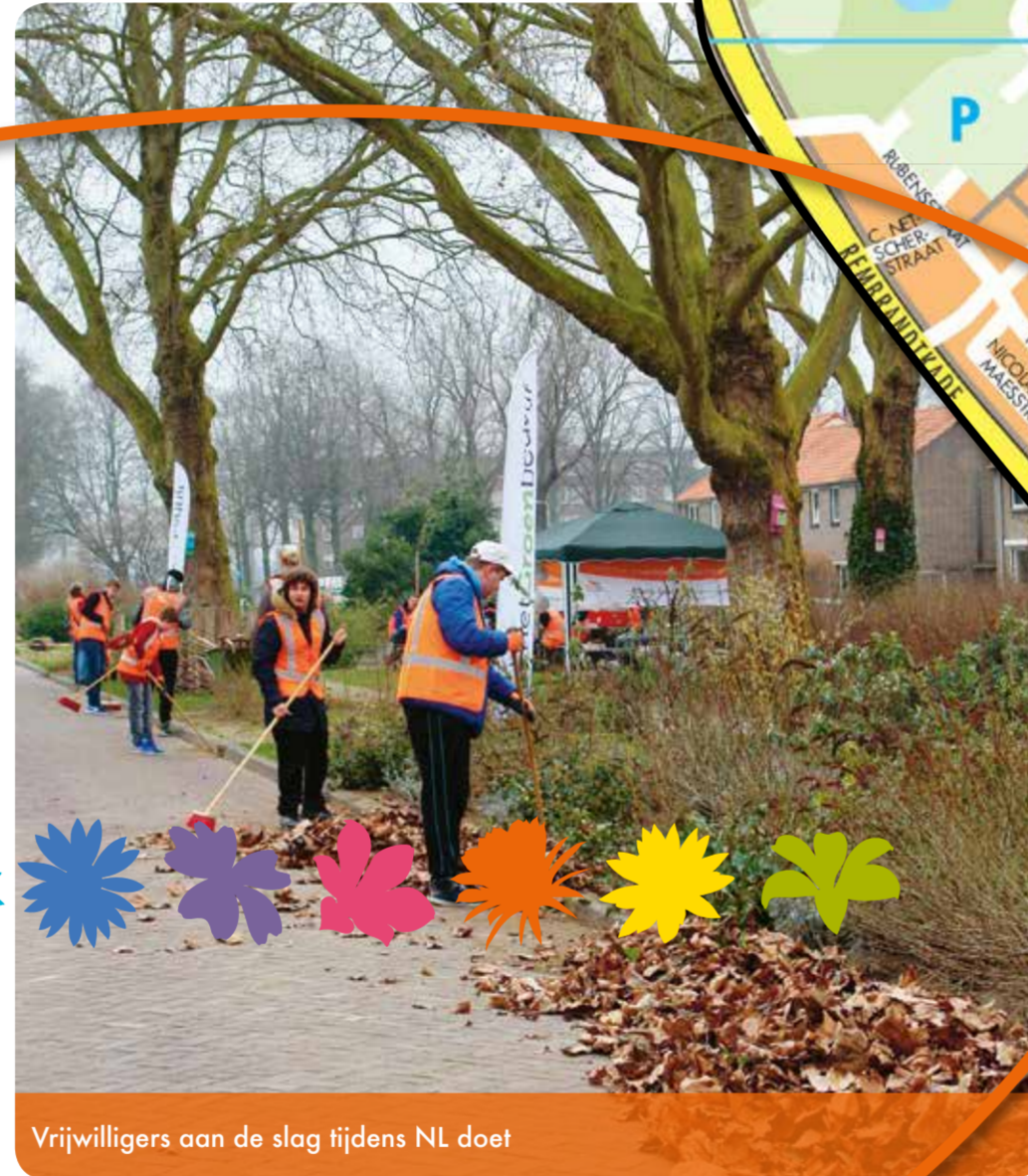
Vrijwilligers aan de slag tijdens NL doet