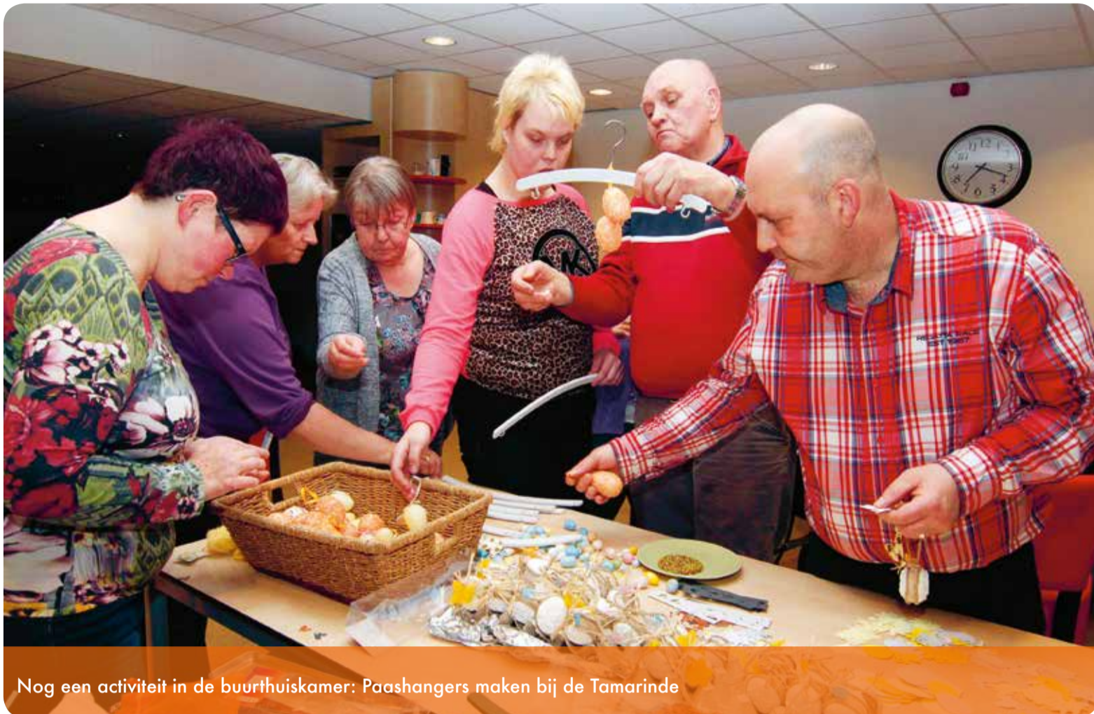
Nog een activiteit in de buurthuiskamer: Paashangers maken bij de Tamarinde