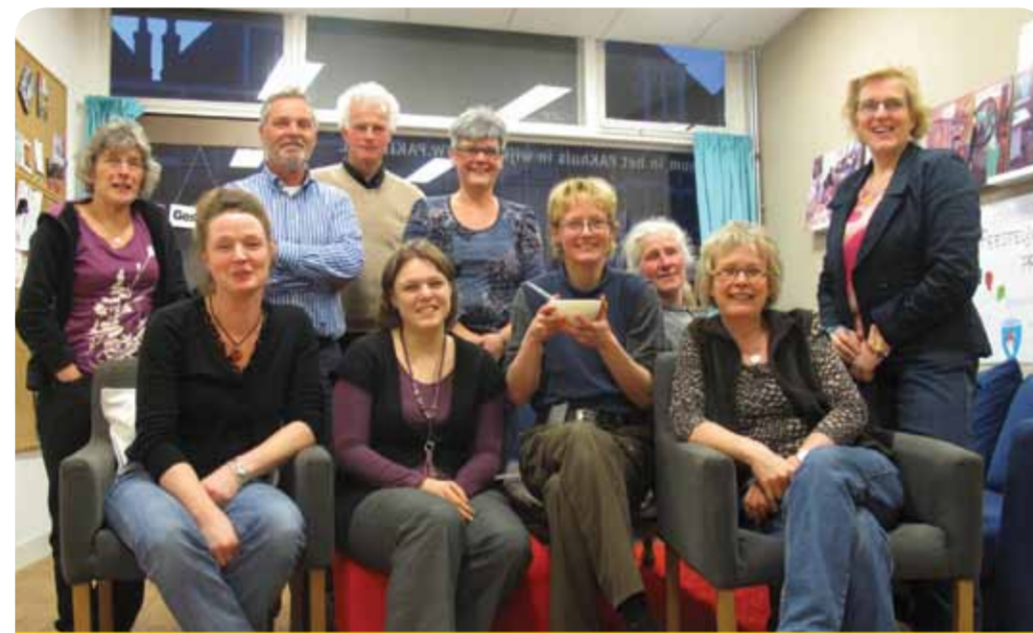
De vrijwilligers van de buurtteetafel

Kortom: proef ook de gezelligheid en het lekkere eten. Dat kan weer vanaf de eerste vrijdag van september. Kijk op www.buurteetafel.nl/voorstad voor het menu en om u aan te melden. De kosten om mee te eten zijn 4 euro voor een hoofdgerecht, een toetje en koffie of thee.