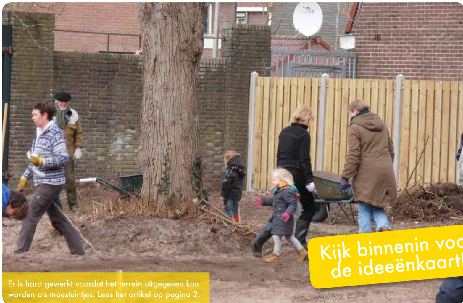
Er is hard gewerkt voordat het terrein uitgegeven kon worden als moestuintjes. Lees het artikel op pagina 2.