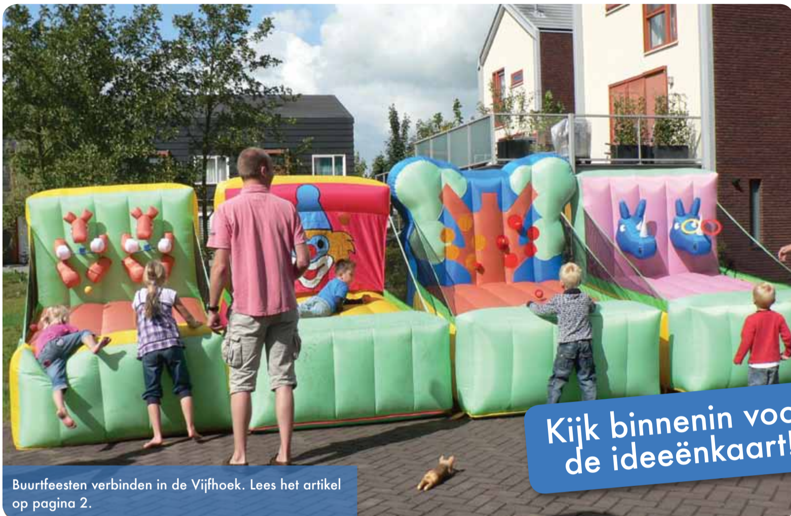
Buurtfeesten verbinden in de Vijfhoek. Lees het artikel op pagina 2.