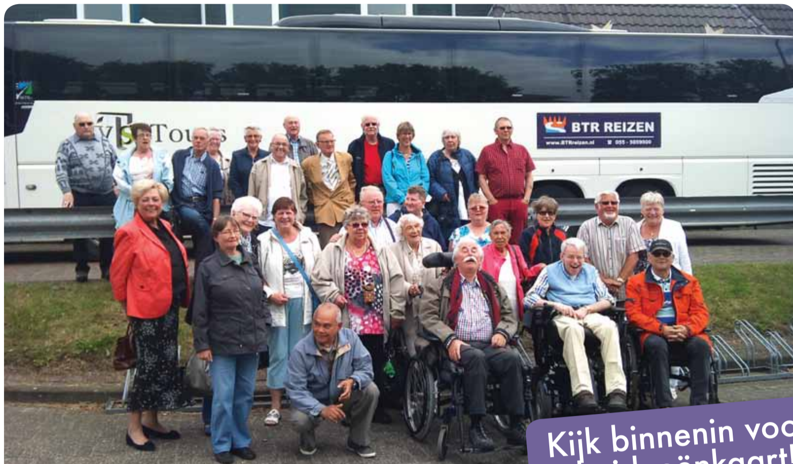
Reisje seniorencafé. Lees het artikel op pagina 2.