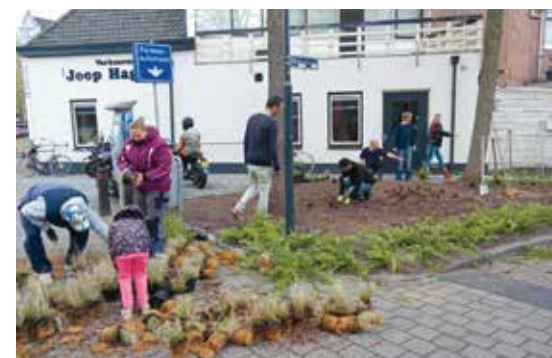
Aanleg van de perken bij de ingang van de Bierstraat

Elke 4e zaterdag van de maand komen ze bij elkaar, bewoners van de Bierstraat en omgeving. Op het programma staat het onderhoud van alle groenperken in de straat. En de straat wordt schoongemaakt. Alle rommel wordt opgeruimd en de straat geveegd. En als er iets kapot is, dan maakt de ploeg het gewoon. De ochtend wordt afgesloten met een kop koffie. Ook niet onbelangrijk, geeft de groep aan. Want naast al het werk is het ook leuk om elkaar te ontmoeten. En soms eten ze zelfgemaakte pizza uit hun eigen pizzaoven in de hapsjtuin aan de Bierstraat.