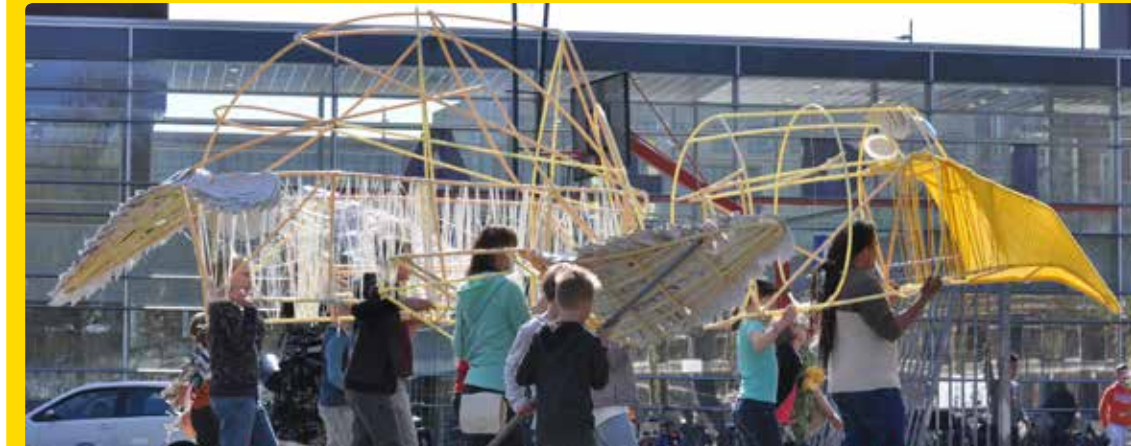
De adelaar wordt gepresenteerd op de Beestenmarkt

de Beestenmarkt liepen de kinderen, met de hulp van buurtbewoners (want hij was toch wel een beetje zwaar), samen trots over het plein. De vleugels bewogen mooi door de lucht. Het was bijna of de adelaar zweefde. Wil je dit nog eens bekijken, ga dan naar: https://vimeo.com/215202142