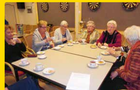
High tea op de Bekkumer

In het voorjaar van 2017 onderzochten Sociaal teamleden samen met de GGD de behoefte van ouderen op de Bekkumer. Maandag 8 mei werden de uitkomsten van dit onderzoek teruggekoppeld aan zo'n 20 bewoners.