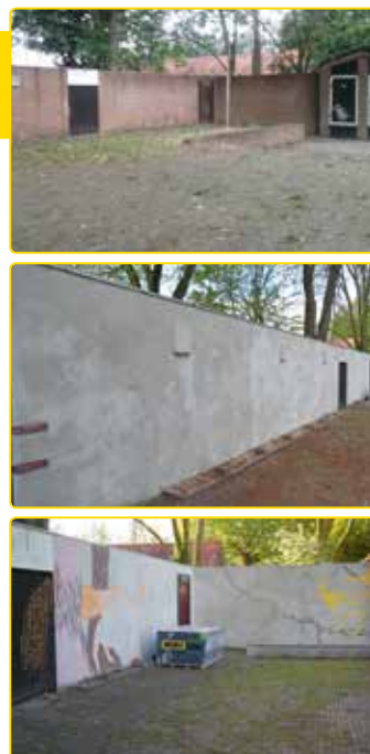
De metamorfose van de muur in de Bekkumer

Eindelijk kon de muur beschilderd worden. Vorig jaar was het plein aan de Ramelestraat al opgeknapt. De muur was gestuukt. Nu hoefde alleen de muur nog beschilderd te worden. Kunstenaars van de Plataan zijn 8 en 9 mei aan de slag gegaan met de uitvoering van hun mooie ontwerp. En wat is het resultaat mooi geworden. De foto geeft een mooie indruk, maar eigenlijk moet je even de fiets pakken en het live bewonderen.