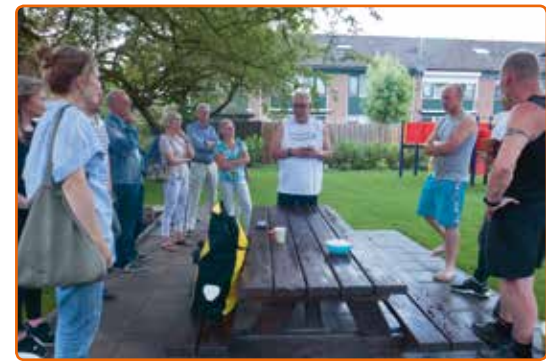
Wijkteam tijdens fietstocht in Beatrixstraat en Nassastraat