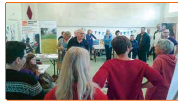
Informatiemarkt 'Keizerslanden seizoen onbeperkt'

Op woensdagochtend 7 juni namen ongeveer 40 bewoners en professionals deel aan de informatiemarkt "Keizerslanden seizoen onbeperkt" in de Ridderhof in Humanitas. Groepen en organisaties die activiteiten organiseren voor mensen met en zonder een beperking, waren aanwezig. De bestaande activiteiten in de wijk werden zichtbaar gemaakt. Aan de tafeltjes werd druk gepraat en informatie uitgewisseld. Of het nu gaat om sport en bewegen, muziek, ontmoeten, meedoen en samen eten. Ook ontstonden er nieuwe ideeën en verrassende verbindingen. Een vraag voor een dartclub op Keizerslanden is al opgepakt. Vrijdag 6 oktober organiseert Philadelphia een dartavond van 18.30 tot 20.00 en nodigt iedereen uit om mee te doen. Het is in de Ridderhof helemaal achter in de gang. Deelname is gratis en de koffie en thee staat klaar.