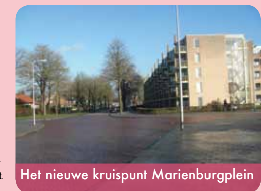
Het nieuwe kruispunt Marienburgplein