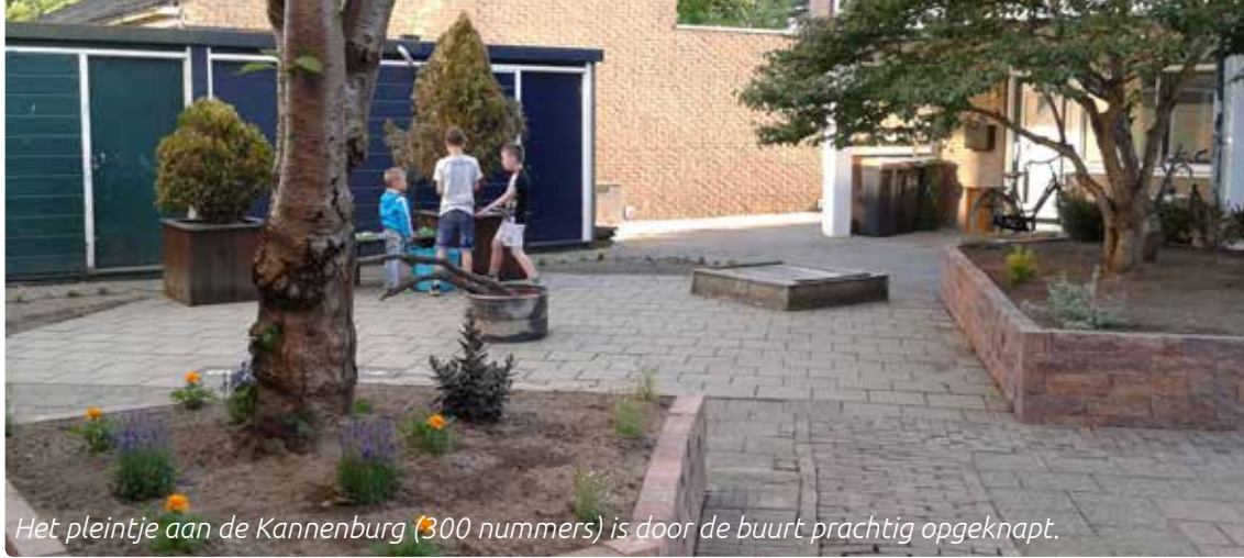
Het pleintje aan de Kannenburg (300 nummers) is door de buurt prachtig opgeknapt.