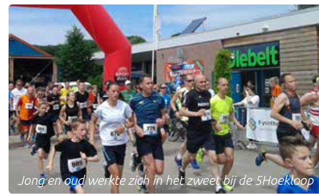
Jong en oud werkte zich in het zweet bij de 5Hoekloop

In juni hebben ruim 700 mensen (oud en jong) meegedaan aan de 4e editie van de 5Hoekloop. Op deze warme dag werd er gelopen in 3 groepen. De eerste groep waren de kinderen in de Kidsrun die 1 kilometer aflegden. Het enthousiasme was enorm en fantastisch om te zien. Het advies van de omroeper om na de start vooral rustig te beginnen werd door de meesten in de wind geslagen. Gelijk voluit ertegenaan. De andere