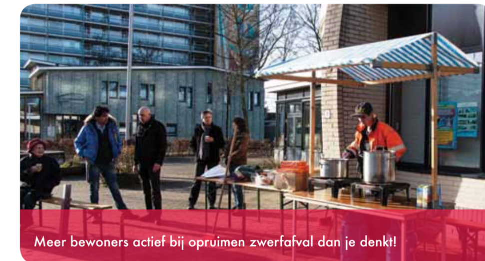
Meer bewoners actief bij opruimen zwerfafval dan je denkt!

Overigens is Eric verhuisd en woont niet meer in Borgele; hij doet een oproepje om het stokje (of in dit geval de grijper) van hem over te nemen om het parkje schoon te maken!