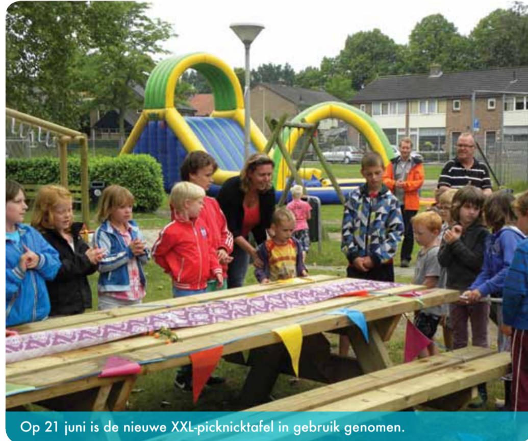
Op 21 juni is de nieuwe XXL-picknicktafel in gebruik genomen.

In september gaan planologiestudenten van Saxion de plannen verder uitwerken en in december presenteren ze een uitgewerkt plan. Dan wordt duidelijk of er behoefte is aan een verbouwing, of zelfs een bescheiden uitbreiding. Wat het wordt, zal ook afhangen van de bereidheid van de wijk om de kosten te drukken door mee te bouwen, net als bij de bouw van het huidige Hovenhuus!