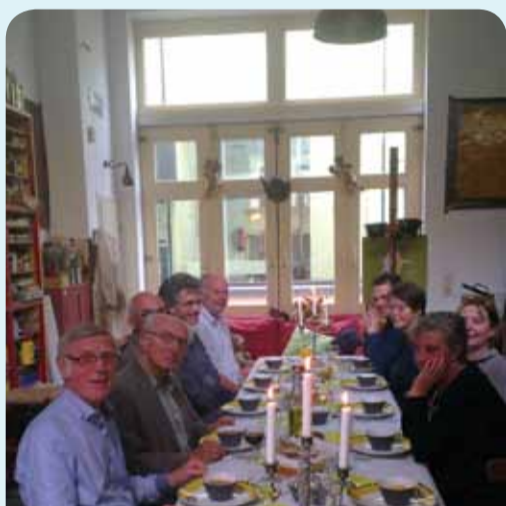
Het wijkteam Hoven/Binnenstad doet met u mee.

Kijk voor meer informatie op: wij.deventer.nl