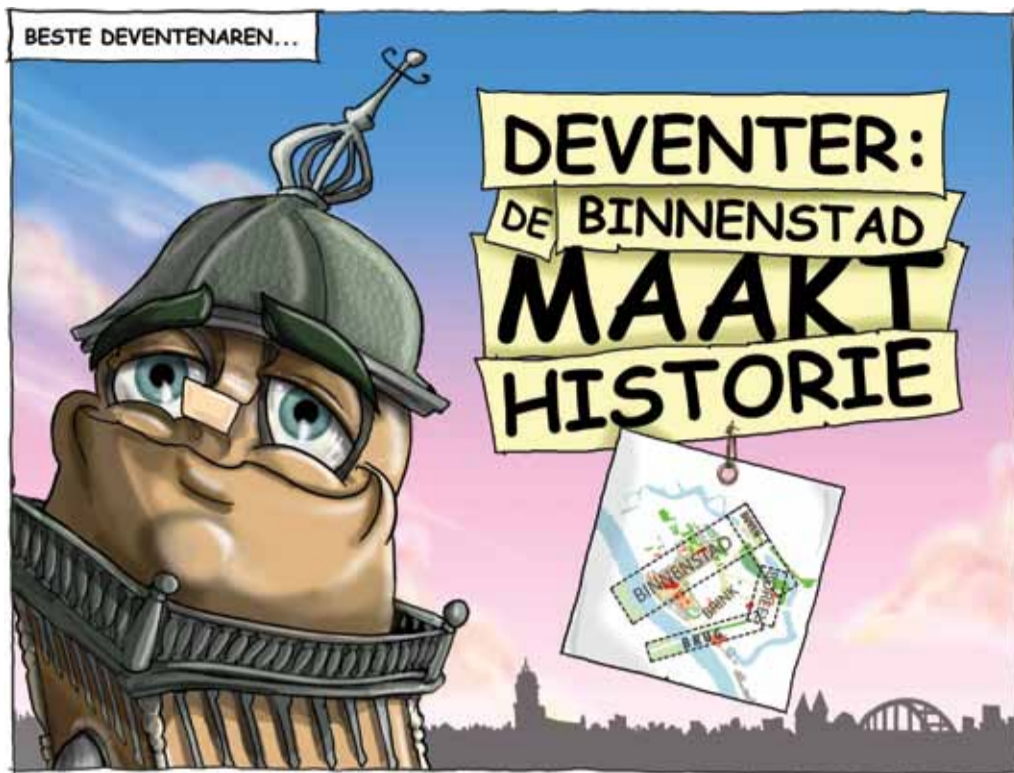
Illustraties: Edo Draaijer. Kijk voor de laatste informatie op: www.deventer.nl/binnenstad .