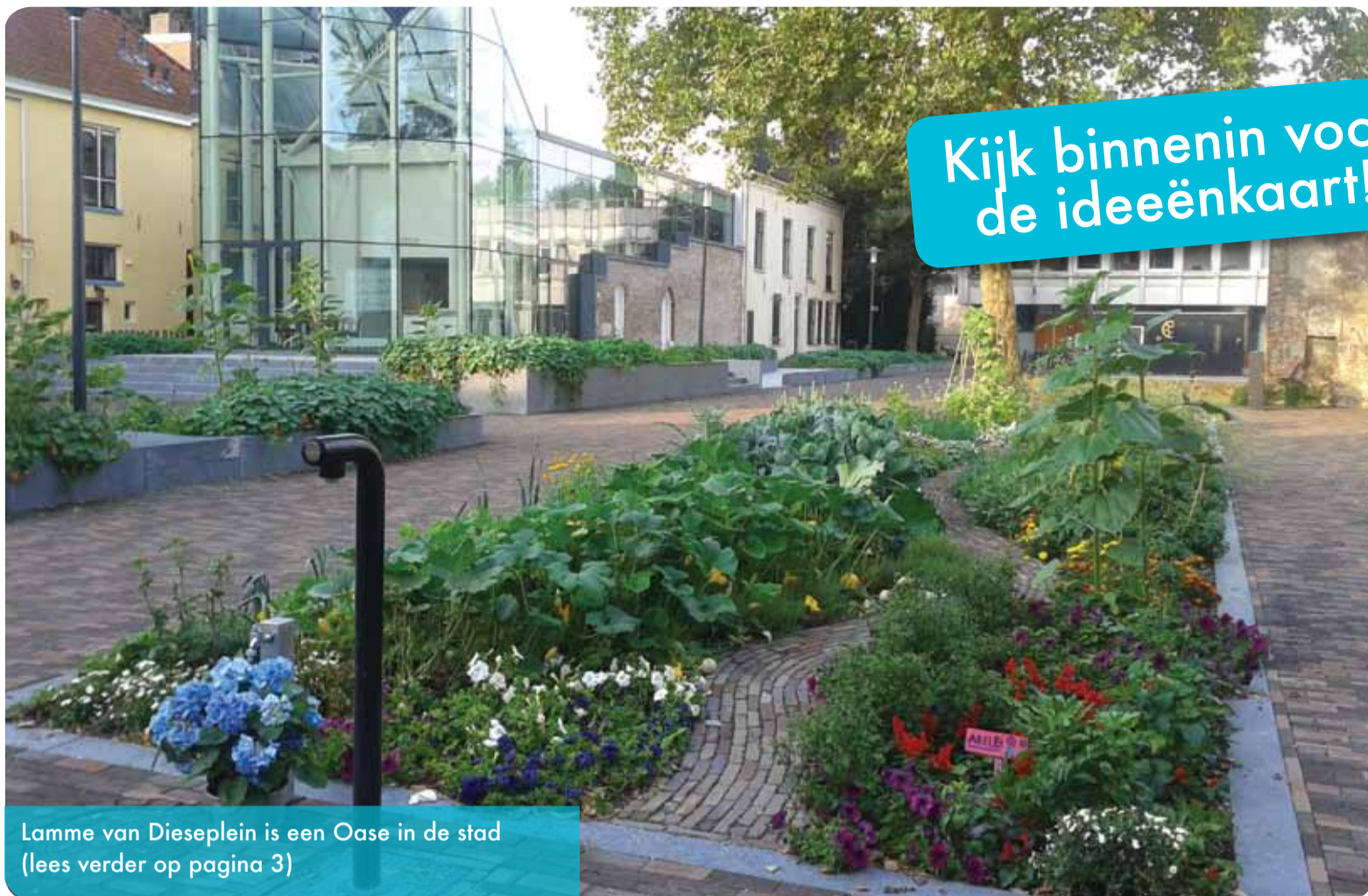
Lamme van Dieseplein is een Oase in de stad (lees verder op pagina 3)