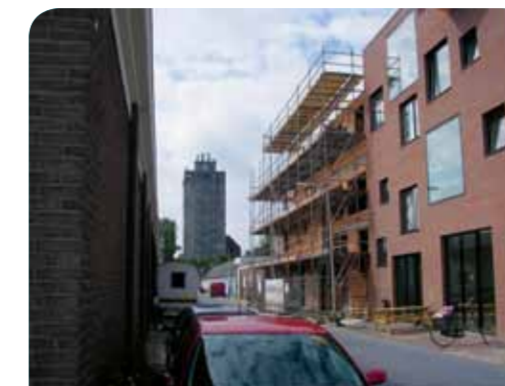
Havenkwartier volop in ontwikkeling.

Het Havenkwartier krijgt veel belangstelling: "In april waren we 'LOS'. Op die open dag konden mensen werkplaatsen, ateliers en studio's bekijken. We gokten op 300 bezoekers, maar het werden er zo'n 1500. Dit gebied zet Deventer echt op de kaart als culturele en economische hotspot. De woningen zijn inmiddels vrijwel allemaal