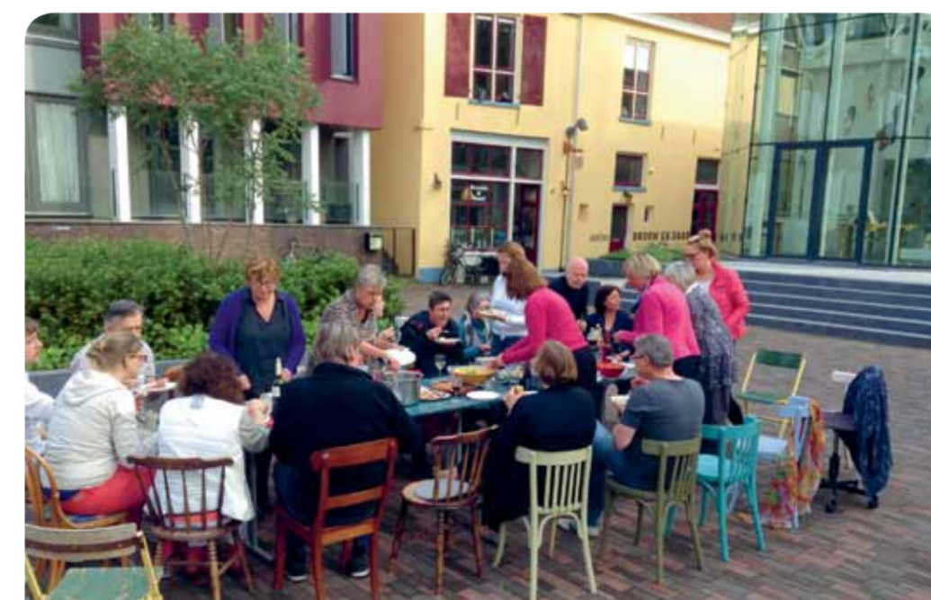
De tuinvrijwilligers eten op het Lamme van Deseplein.