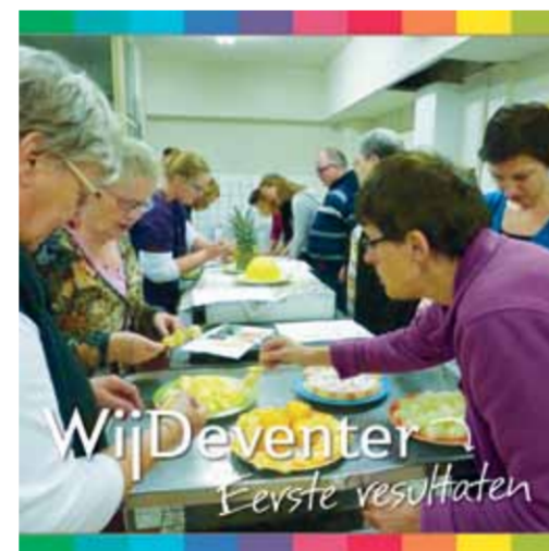
WijDeventer Eerste resultaten

Wilt u het boek graag inzien? Op de website www.wijdeventer.nl (onder het kopje Informatie) kunt u het downloaden.