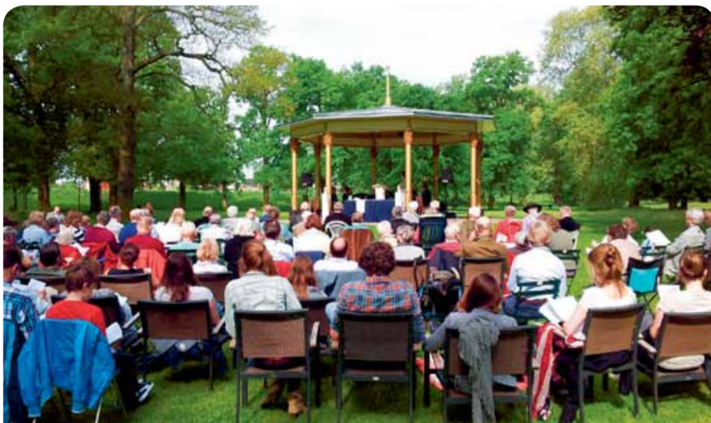
Gebruik Worpplantsoen op zondagen bij de muziekkoepeel.

In 2013 overleed Worbewoner Willem Waanders. Hij liet zijn huis en geld na aan de gemeente, met als voorwaarde dat de opbrengst zou worden gebruikt voor de verfraaiing van het Worpplantsoen. De gemeente heeft een aantal enthousiaste betrokkenen gevraagd om een manier te bedenken om het bedrag van zo'n 120.000 euro zo goed mogelijk te verdelen. Daarbij zijn in ieder geval de groepen betrokken die een rol spelen in het Worpplantsoen, zoals de Stichting Muziekkoepeel Worpplantsoen, Worp Wegwerpvrij, het Steenworp festival en de mensen die zich nu al voor het beheer van het plantsoen inzetten. In de loop van het jaar wordt meer duidelijk over de verfraaiingen in het plantsoen.