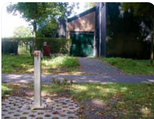
Het nieuwe waterpunt met op de achtergrond het openbare toilet.

Het Worpplantsoen was altijd al een populaire plek in Deventer en sinds de muziekkoepeel in het park staat, is de belangstelling nog groter. En daarmee groeide de behoefte aan goede voorzieningen, zoals een toilet en een tappunt voor water. De Stichting Muziekkoepeel Worpplantsoen kon dat regelen.