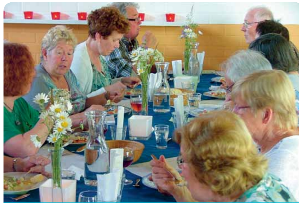
Happen op de Hoven.