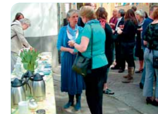
Het vorige feest in de Assenstraat in 2012.

Meer informatie: www.assenstraat.nl/burendag .