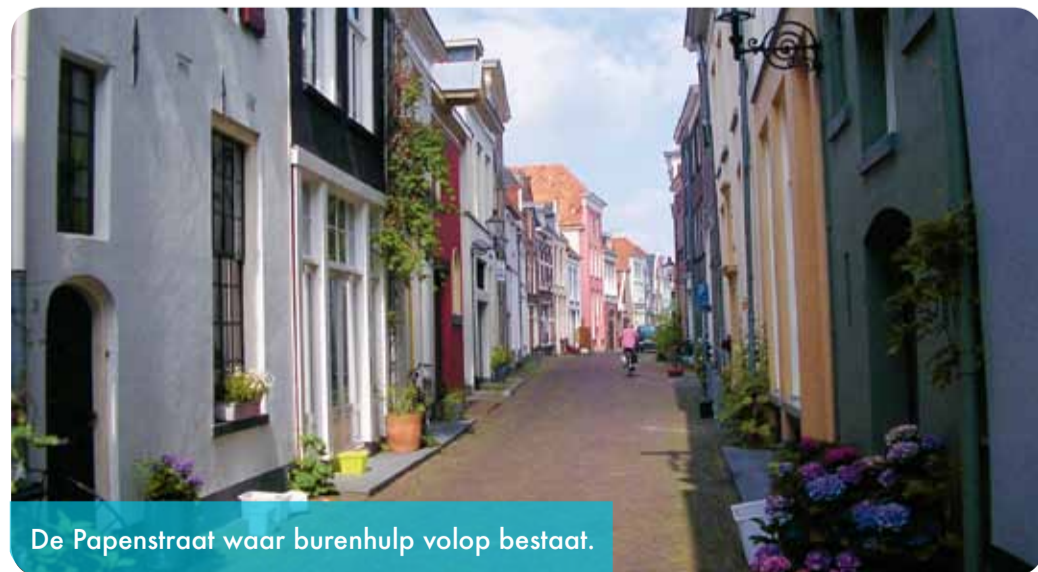
De Papenstraat waar burenhulp volop bestaat.

Het was een schok voor de burens, maar ze dachten ook al direct over de hulp die ze zouden kunnen geven, zoals af- en toe koken of de boodschappen doen. Sommige hulp was ogenschijnlijk simpel, maar heel belangrijk. Een van de burens: "Bram was gewend om 's ochtends bij Floors in alle rust de Volkskrant te lezen. Toen dat voor hem te ver weg was, liep hij naar een café dichterbij. Maar ook dat lukte niet meer. Toen heb ik voorgesteld dat hij de straat over zou steken om de krant bij mij te lezen. En de laatste tijd kwam ik naar hem toe."