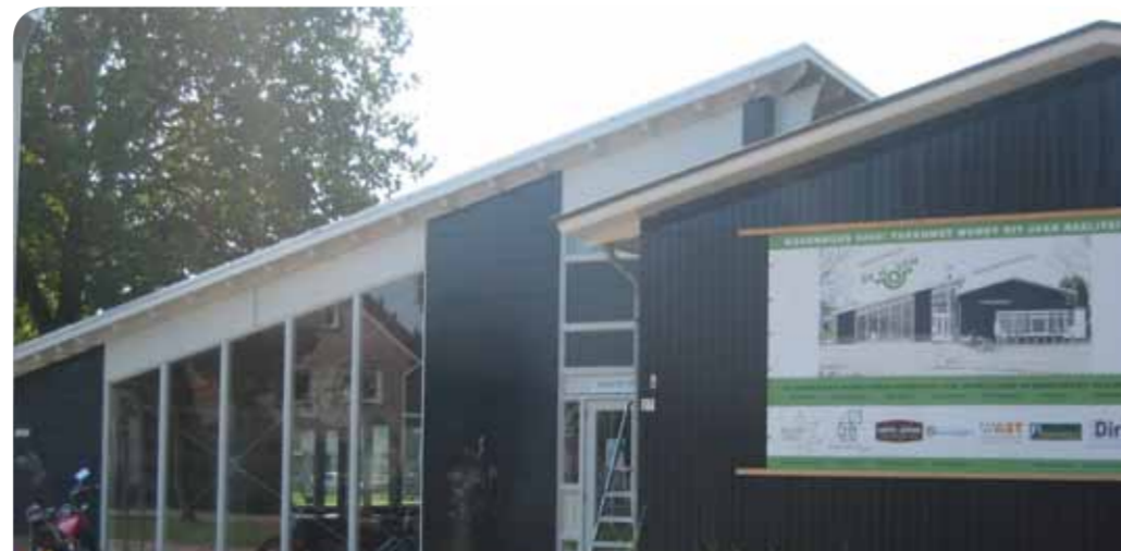
Het Hovenhuus na de verbouwing

uit de wijk. Bewoners dachten in de inrichtingscommissie mee over onder andere