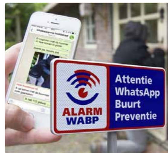
Voorbeeld van een bord

Wilt u een groep starten met uw straat of buurt, organiseer dan bijvoorbeeld een bijeenkomst waarvoor u ook de wijkagent uitnodigt. Die vertelt u graag hoe u WhatsApp optimaal inzet. Op de site van WhatsApp Buurtpreventie, wabp.nl , staat een kaart met actieve groepen die zich al hebben aangemeld. Hier staat ook meer informatie. Wilt u een bord plaatsen in de straat? WijDeventer betaalt mee aan (maximaal) twee borden per initiatief. Hiervoor kunt u contact opnemen met de wijkmanager. Bewoners betalen zelf de sticker met de afbeelding voor op de borden.