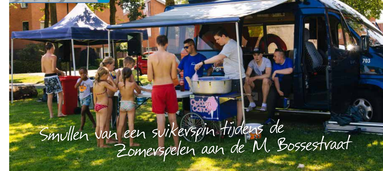
Smullen van een suikerspin tijdens de Zomerspelen aan de M. Bossestraat