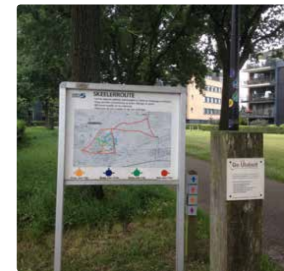
Routekaart van wandel- en skeeleroutes

De wandeling van 3,5 kilometer is ook heel geschikt voor kinderen, vanwege de lengte, maar ook omdat de route langs allerlei spannende speelplekken voert. Daarnaast bestaan er ook skeeleroutes variërend van bijna 4 tot 17 kilometer. Alle routes zijn gemarkeerd met stickers. Elke route heeft een eigen kleur. De routes zijn in 2006 en 2007 door bewoners (onder de vlag van WijDeventer, wat toen nog Wijkaanpak heette) uitgezet.