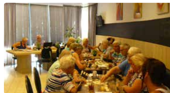
Seniorengroep De Colmsoos actief in de Fontein

VC De Fontein, Fonteinkruid 61 De Kuip, Bloemendalsweg 1B SV Helios, Corrie Tendeloostraat 4 Ichtuskerk, Holterweg 106 Huize Salland, Bloemendalsweg 5 Titus Brandsma Huis, Titus Brandsmaplein 2