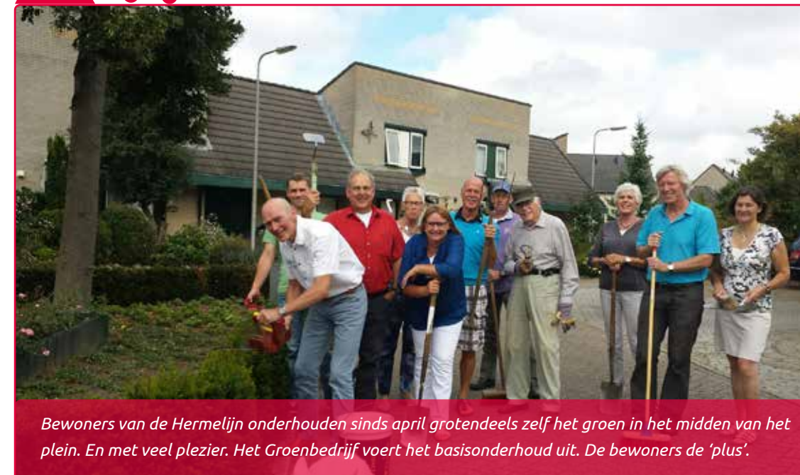
Bewoners van de Hermelijn onderhouden sinds april grotendeels zelf het groen in het midden van het plein. En met veel plezier. Het Groenbedrijf voert het basisonderhoud uit. De bewoners de 'plus'.