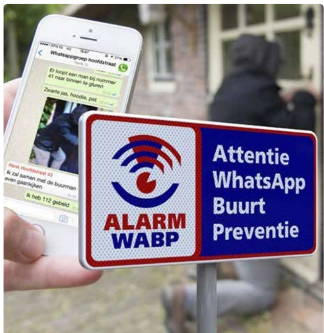
Voorbeeld van een bord