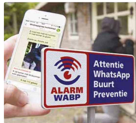
Voorbeeld van een bord

Wilt u een groep starten met uw straat of buurt, organiseer dan bijvoorbeeld een bijeenkomst waarvoor u ook de wijkagent uitnodigt. Die vertelt u graag hoe u WhatsApp optimaal inzet. Op de site van WhatsApp Buurtpreventie, wabp.nl, staat een kaart met