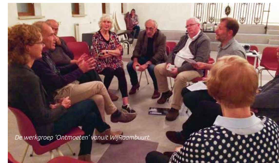
De werkgroep 'Ontmoeten' vanuit WijRaambuurt.

de indieners van een idee en het besluit over een aanvraag uit het wijkbudget. Het is niet langer het wijkteam dat plannen goedkeurt, maar bewoners (de kerngroepen) krijgen een budget dat ze volgens bepaalde afspraken kunnen besteden. Later verantwoorden ze de uitgaven aan het wijkteam. De buurt Polstraat e.o. gaat ook deelnemen aan de pilot. Belangenvereniging Polstraat e.o. neemt hier het initiatief in. De drie buurten staan er uiteraard niet alleen voor. Waar nodig krijgen ze ondersteuning van het sociaal team, het wijkteam, organisaties in de wijk of de wijkmanager.