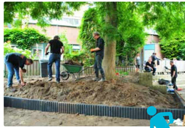
Omwonenden hard aan het werk op de klusdag van het Nollesgat

Omwonenden van het Nollesgat hebben samen een plan gemaakt om hun plek weer op te knappen. Het Nollesgat is de speelplek tussen Molenstraat, Lindestraat en Korte Noordenbergstraat. Het groen en enkele aanpassingen aan het pad zijn in eigen beheer onder handen genomen. Op 16 juli is er een hele dag hard gewerkt. Intussen zijn er ook 3 poorten geplaatst om de mogelijkheid te hebben om het Nollesgat 's avonds en 's nachts af te sluiten, dit om de overlast die er de afgelopen jaren was terug te dringen. Alles