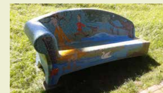
de nieuwe mozaïekbank