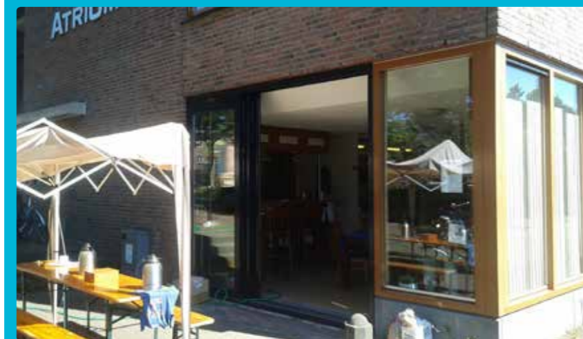
De nieuwe schuifpui open tijdens de Summerfun

plannen gesmeed om dit te verbeteren. Een schuifpui met uitzicht op de speeltuin zou de oplossing voor dit probleem zijn. Gesproken met de burens, gesproken met de woningbouwvereniging, tekeningen gemaakt en subsidie gevraagd. En mede dankzij verschillende subsidies kon de schuifpui vlak voor de zomer geplaatst worden. Tijdens de jaarlijks terugkerende Summerfun hebben ze er ontzettend veel plezier van gehad.