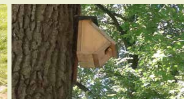
allerlei soorten nestkastjes