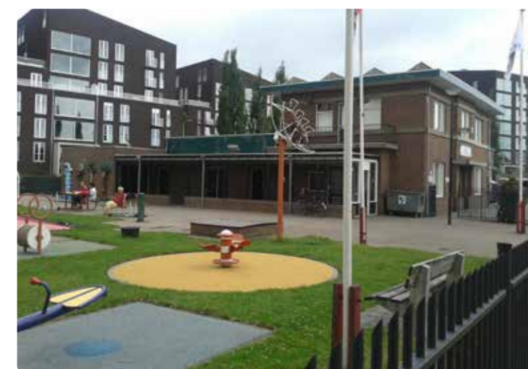
Aan de speeltuinzijde van het gebouw zal straks de uitbreiding komen voor de dagbesteding.