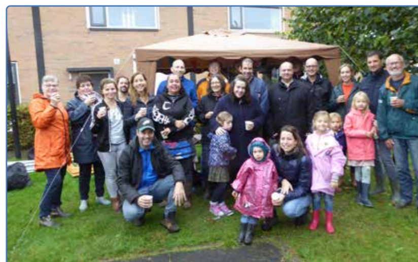
Buurtfeest oude stijl, nu even niet

De Vijfhoek staat in de zomerperiode bekend om zijn vele straat- en buurtfeesten. Deze kunnen dit jaar vanwege de Coronamaatregelen (waarschijnlijk) niet doorgaan. Dat is jammer omdat buurtfeesten een prachtige gelegenheid zijn om elkaar beter te leren kennen. We weten dat er regelmatig op straatfeesten een zaadje is geplant voor een prachtig buurtinitiatief. Een buurtfeest in de oude vorm zal niet kunnen, maar het is natuurlijk interessant om na te denken hoe die kennismaking met elkaar op een andere manier zou kunnen die wél past binnen de huidige maatregelen. Hoe fijn zou het al zijn om van iedereen in de straat te weten of het goed gaat, of dat je toch nog iets extra's voor iemand kunt betekenen. Voor een idee kun je, wanneer dat nodig is, een subsidieaanvraag doen via www.wijdeventer.nl .