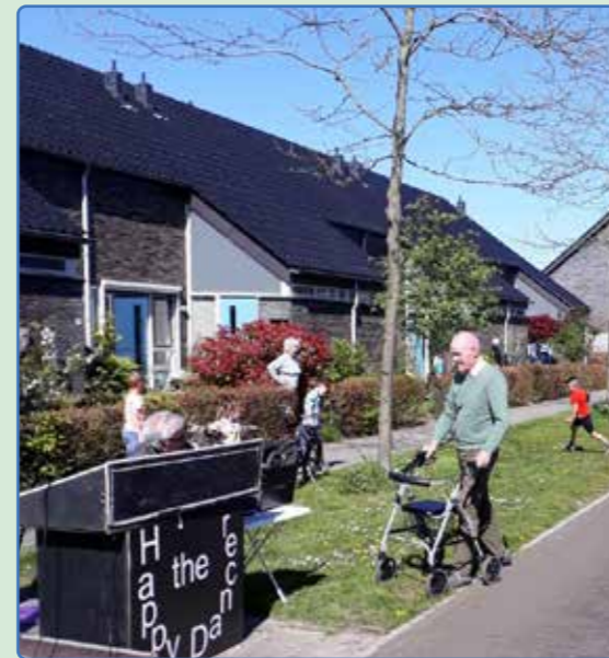
Bewoners uit de Jacob Oliestraat komen voor de muziek uit hun huis