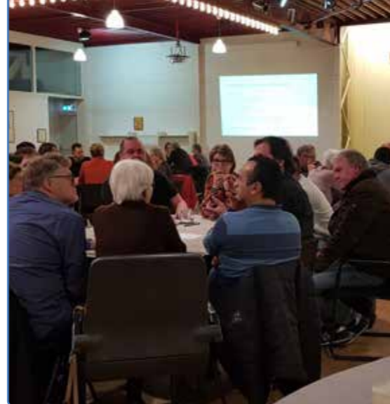
In groepen werd over verschillende VVE-thema's gesproken

Dit gedeelte kun je opsturen naar WijDeventer. Er wordt dan contact met je opgenomen om te vragen of je direct aan de slag kunt of dat je iets nodig hebt om je idee verder uit te werken en uit te voeren.