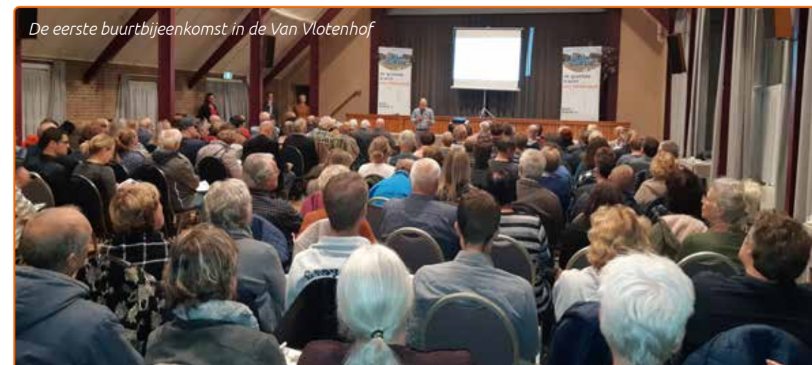
De eerste buurtbijeenkomst in de Van Vlotenhof

Wil je mensen echt in actie zien? Op de site staan inspirerende video's van Deventenaren die de handen uit de mouwen steken. Ga je ook aan de slag met energiematregelen en wil je ook schitteren in een van de video's? Laat ons weten wat je gaat doen, wanneer, hoe, waar en met wie. En maak kans op jouw eigen videoclip. Kijk op www.deventerstroomt.nl voor meer informatie.