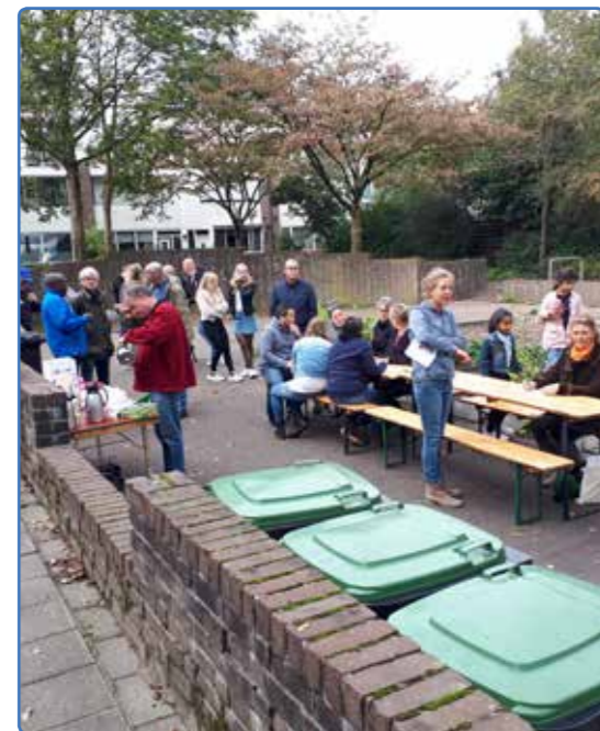
De succesvolle bijeenkomst op 5 oktober

In het Oostrik is de Werkgroep Groen en Afval inmiddels gestart met het eerste project, waarbij het centrale plein bij de Doornenburg (nabij de Titus Brandsmakerk) aangepakt zal worden. Op zaterdag 5 oktober kwam een aantal bewoners van het plein bijeen om over de mogelijke inrichting te praten. Aan de hand van een schets en enkele toelichtingen zijn er ideeën uitgewisseld. Deze zijn door de werkgroep verzameld en met deze input wordt gekeken wat ervan te realiseren valt, maar ook wat er niet moet worden gedaan. Tijdens deze zaterdag werd door een aantal kinderen de wens geuit, dat ze speeltoestellen op het plein willen, waar ze op kunnen zitten, klauteren en ravotten. Daarnaast kwamen de bewoners met voorstellen om onder andere een wilde tuin aan te leggen. De aanwezigheid van de Ulebelt zorgde ervoor dat er ook naar