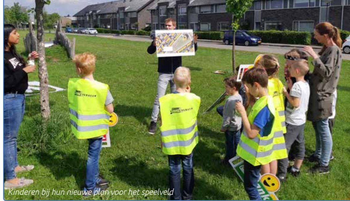
Kinderen bij hun nieuwe plan voor het speelveld

de toekomst werd gekeken (afkoppelen regenwater, sedumdaken, minder verharde ondergrond). Naast de Ulebelt waren ook Cambio en Raster vertegenwoordigd.