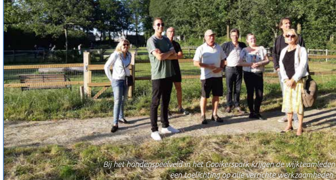
Bij het hondenspeelveld in het Gooikerspark krijgen de wijkteamleden een toelichting op alle verrichte werkzaamheden.

Dit gedeelte kun je opsturen naar WijDeventer. Er wordt dan contact met je opgenomen om te vragen of je direct aan de slag kunt of dat je iets nodig hebt om je idee verder uit te werken en uit te voeren.