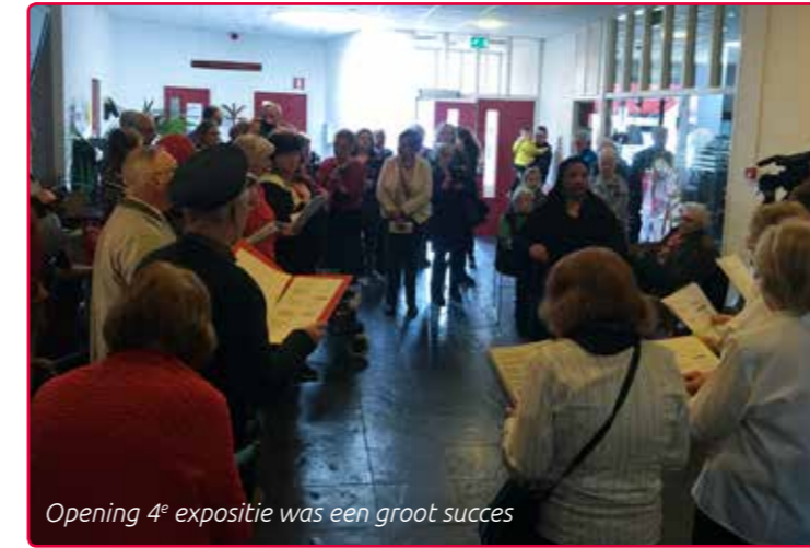
Opening 4 e expositie was een groot succes

'Van Dichtbij' is alweer de zesde expositie in Buurtmuseum Borgele. Deze keer zijn er maar liefst vier zeer getalenteerde buurtgenoten die hun werk tonen. De expositie is van 28 september tot 10 december 2019 te bezichtigen tijdens de openingsuren van de Schalm. De toegang is gratis.