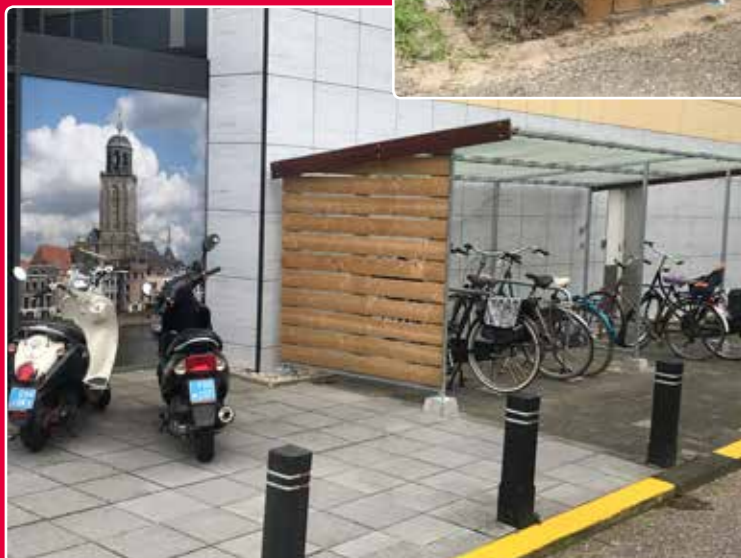
De nieuwe overdekte fietsenstalling