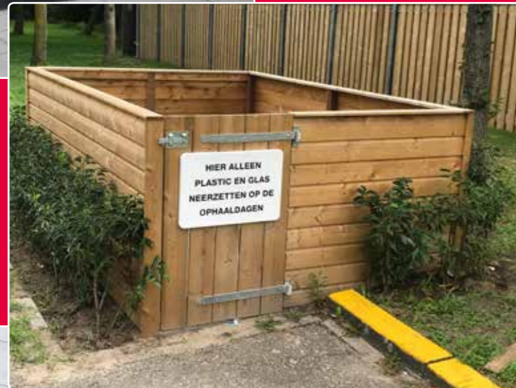
De verzamelplaats voor afval