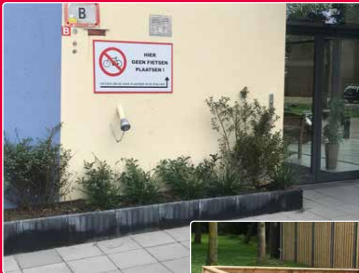
Beplanting, voorheen fietsenstalling