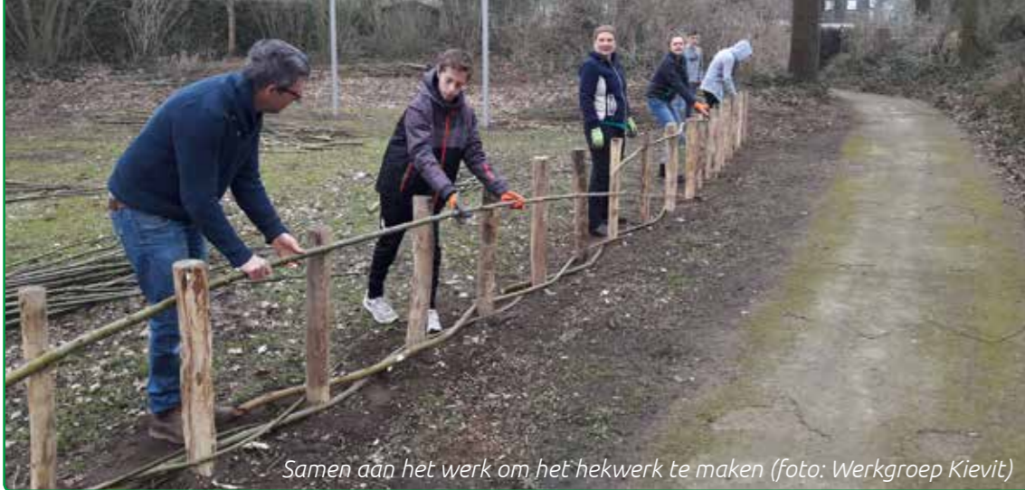
Samen aan het werk om het hekwerk te maken