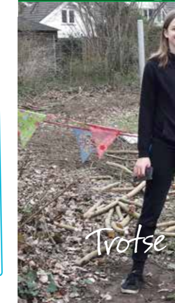
Trotse jongeren aan de Kievit/Groenting