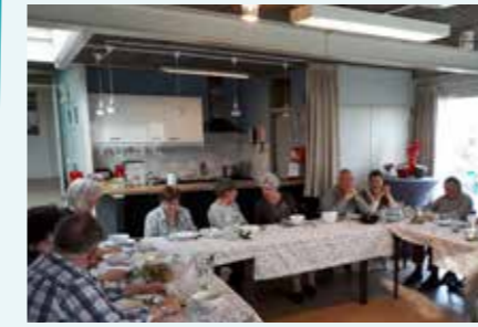
Het donderdagdiner in volle gang

Het diner wordt elke 2 weken op donderdagavond gehouden en is al meer dan 150 keer een groot succes. Als het je leuk lijkt om een keertje mee te eten, of misschien zelfs mee te komen koken en gastvrouw/heer te zijn stuur dan een mailtje naar donderdagdiner@gmail.com . Bellen mag ook naar 0570 656445.