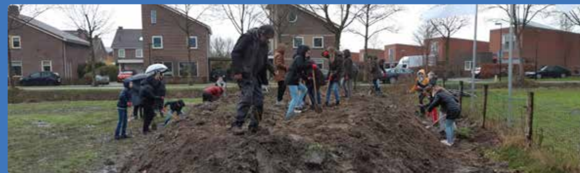
Kinderen aan het werk tijdens de Boomfeestdag

Doet hebben vrijwilligers, in de stromende regen, bomen en struiken aangeplant. Binnenkort, wanneer de afrastering staat, grazen de Maasduiner schapen in het gebied! Het gebied oogt nu nog modderig en kaal, maar het wordt een gebied met meer bloemen, beschutting, bessen en noten, waar vogels en insecten volop voedsel kunnen vinden. Via kleine overstapjes mogen mensen (honden niet) het gebied in, om van dichtbij van al dit moois te genieten. Kijk voor meer informatie op landjevanniets@concepts.nl . De officiële opening van het Landje van Niets (Willem Pijperstraat) is op vrijdag 17 mei om 16.30 uur. U bent van harte welkom.