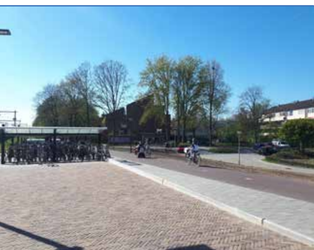
De werkgroep start met de aanpak van groen en afval bij het station

opgevat om klein te beginnen en als een inktvlek de wijk in te trekken. Als startpunt is het vernieuwde station van Colmschate gekozen. Een plek van waaruit men de wijk intrekt, hetzij lopend, hetzij fietsend. Het eerste initiatief is om met ProRail te bekijken of het mogelijk is een toilet op het station te realiseren. Hiermee wil de werkgroep voorkomen dat mensen hun behoefte in de groenvoorziening of bij mensen in de tuin doen. Het tweede initiatief wordt het plaatsen van prullenbakken rondom het station. De daaropvolgende initiatieven worden samen met mensen uit de betreffende buurt opgepakt. En om een inktvlek te beginnen starten we nabij het station.