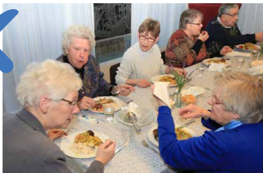
Gezellig samen eten in het Titus Brandsmahuis