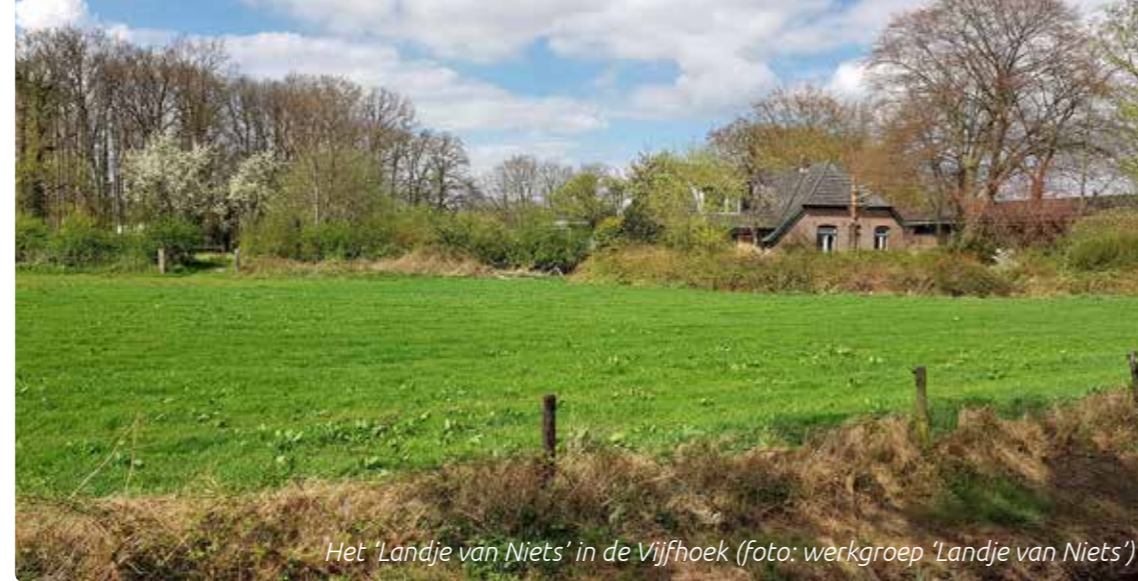
Het 'Landje van Niets' in de Vijfhoek