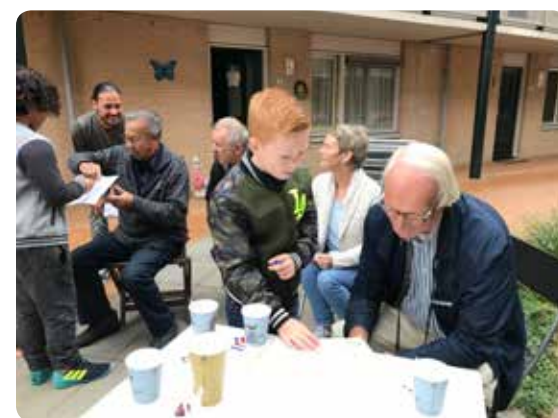
Bewoners appartementen Zandweersweg en leerlingen Cees Wilkeshuisschool ontmoeten elkaar