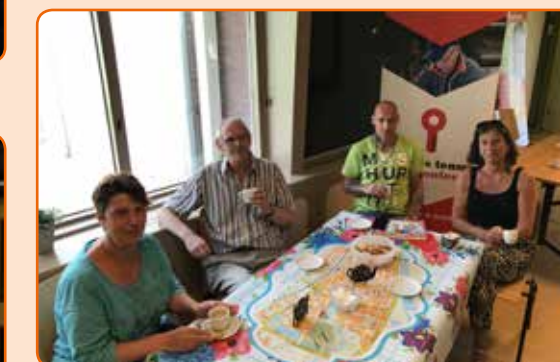
Samen rijk in de wijk.