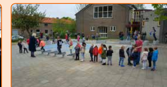
Opening beweegplein Cees Wilkeshuisschool