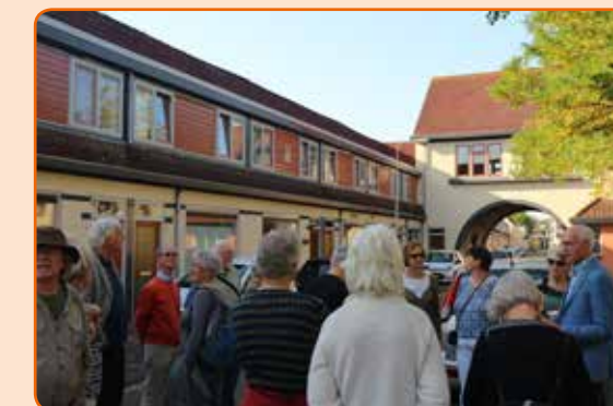
Historische wandeling in de Zandweerd

Ook in 2017 zijn er weer veel bewoners geweest die elkaar ontmoet hebben. Hieronder een greep uit de activiteiten die hebben plaatsgevonden in de Zandweerd in 2017. Ik nodig jou uit om ook in 2018 mooie activiteiten te organiseren voor je straat, buurt of wijk en ik ontvang daar graag de foto's van!