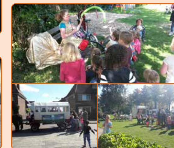
Burendag Zandweerd 2017