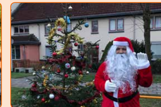
Kerstfeest Gerard ter Borchplein en omgeving